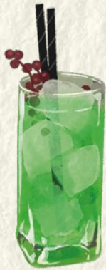
RAMUNE HAI Ramune · Shochu Ramune · Shochu