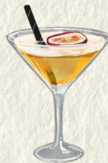
PORNSTAR MARTINI Vodka · Passion Fruit · Lime · Vanilla Vodka · Maracuyá · Lima · Vainilla