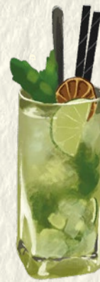
MOJITO Rum · Lime · Mint Ron · Lima · Menta