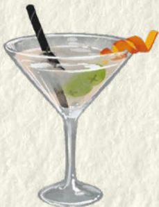
SAKETINI Sake · Dry Gin · Olives Sake · Dry Gin · Olivas