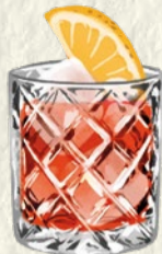
NEGRONI Gin · Vermouth · Bitter Ginebra · Vermú · Bitter